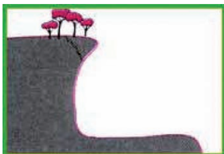
Fig.1 : l'aléa

ALEA : Possibilité de l'apparition d'un phénomène ou événement résultant de facteurs ou de processus qui échappent, au moins en partie, à l'homme.