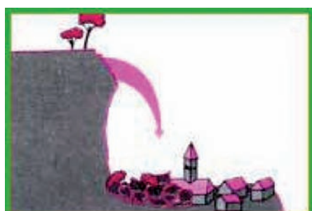
Fig.3 : le risque majeur

RISQUE : Combinaison d'enjeux soumis à un aléa.