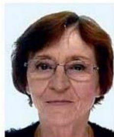
M me FLORENTIN DISTRICT 22

Voici les agents chargés du recensement :