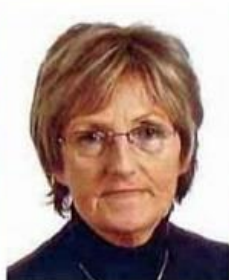
M me NEURY DISTRICT 27